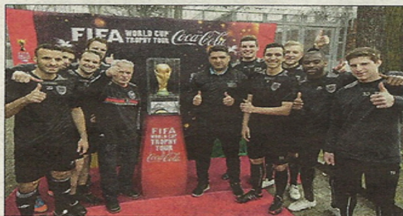
Nur gucken, nicht anfassen – der WM-Pokal in der Jugendstrafanstalt Plötzensee mit Spielern des SV Babelsberg 03, die gegen eine JSA-Auswahl antraten.