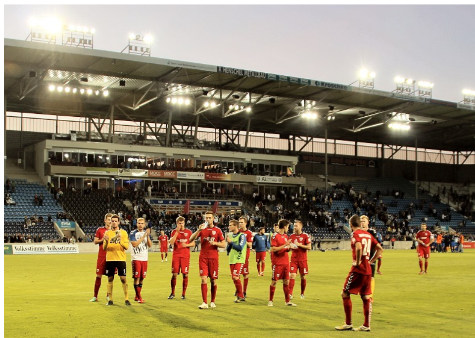
Gegen den 1. FC Magdeburg

Am Wochenende ist Punktspielpause. Nulldreie gastiert im Landespokal am Freitag-Abend bei Union Klosterfelde. In einer Woche kommen die leidgeprüften Jenenser zum Besuch ins Karli.