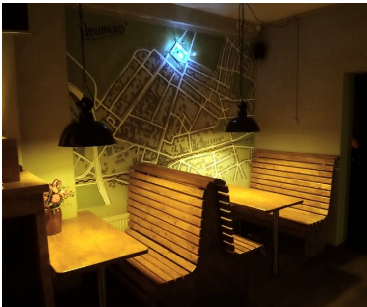
Die Babelsberger Stadtteilkneipe

Die Stadtteilkneipe "NOWAWES", Großbeerenstraße 5, hat kürzlich nach umfassender Renovierung wiedereröffnet. In gemütlicher Atmosphäre bietet das "NOWAWES" Platz zum Quatschen, Chillen, Fußball schauen und für vieles mehr. Geöffnet ist täglich ab 16 Uhr.