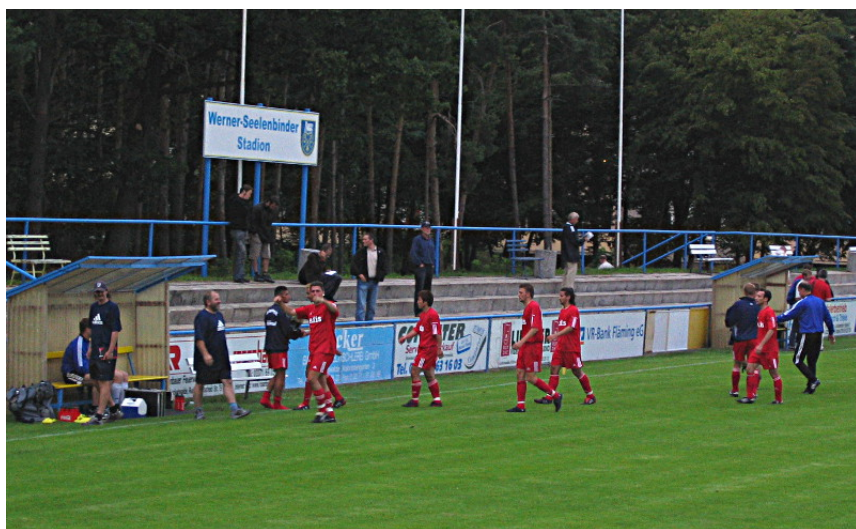
Im FLB-Pokal gab es bereits mehrere

Babelsberg und Luckenwalde trafen in dieser Spielzeit erstmals im Meisterschaftswettbewerb aufeinander. Im heimischen Karli bezwang Babelsberg den FSV 63 Luckenwalde mit 6:1. Die Partie in Luckenwalde endete 1:1, wobei Luckenwalde der Ausgleichstreffer erst in der Nachspielzeit gelang.