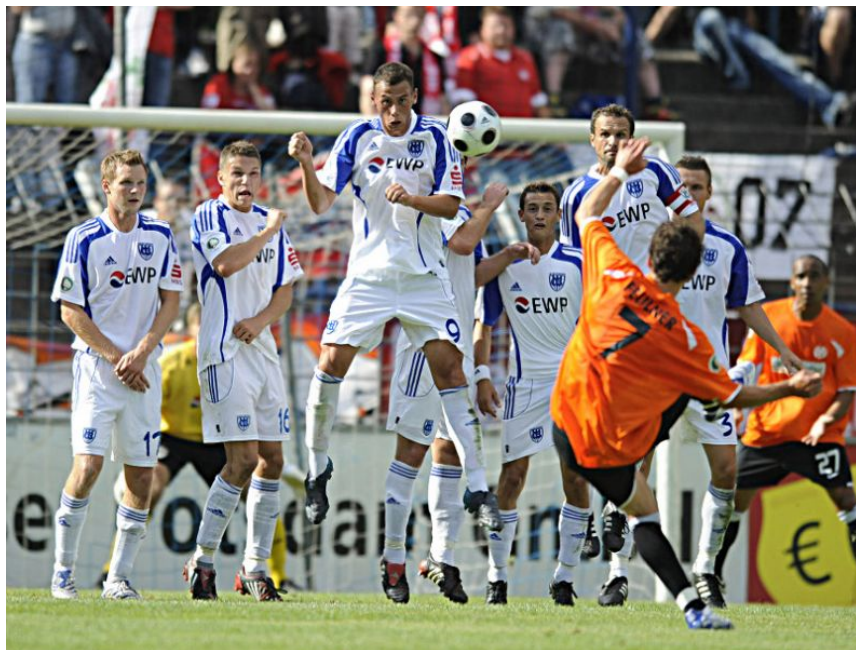
Die Finalgegner Babelsberg und