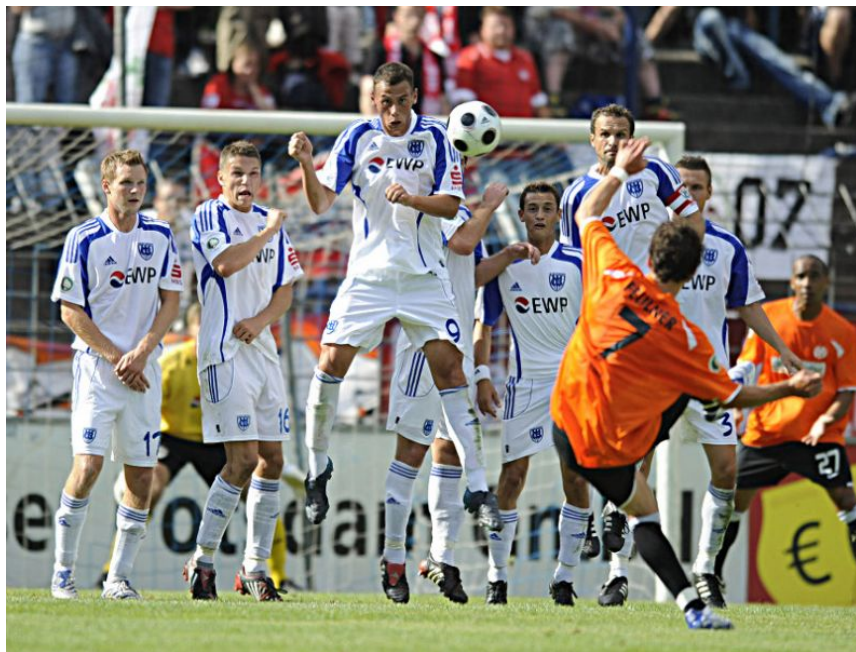
Die Finalgegner Babelsberg und