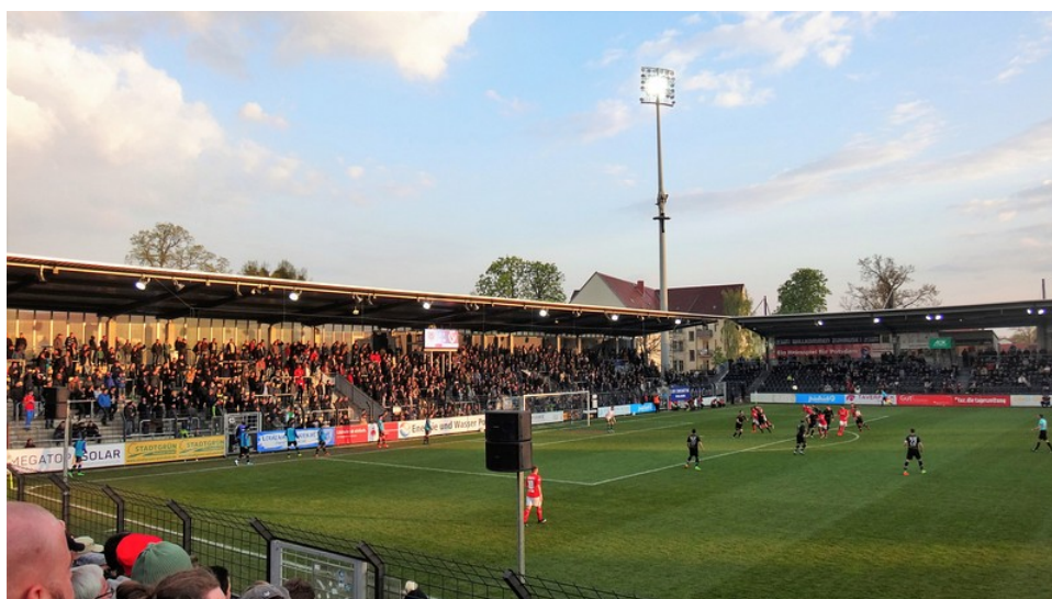
Nach etwas mehr als zehn

Nach circa 25 Minuten muss Schiri Lars Albert das erste Mal unterbrechen. Cottbuser Arschkrampen schießen mit Feuerwerk auf den Platz und in die Nordkurve, wenig später versuchen sich ein paar Heinis an einem Platzsturm. Die ganze Armut wird mit dem üblichen Geblöke begleitet: „Arbeit macht frei – Babelsberg 03“, „Zecken, Zigeuner und Juden“ schallt es aus einem nicht unerheblichen Teil des Gästeblocks. Der strafbare, sogenannte "Hitlergruß" wird ausgiebig und mehrfach gezeigt. Die vermeintliche Gegenwehr des Großteils der Cottbuser Fans gegenüber Rechtsextremen und Gewalttätern, wie sie beispielsweise aus Bautzen berichtet wurde, ist weder akustisch noch visuell auszumachen. Zusätzlich zum Ordnungsdienst zieht die Polizei auf und sichert den Innenraum, derweil sind die Teams vom Schiedsrichter in die Kabinen beordert worden.