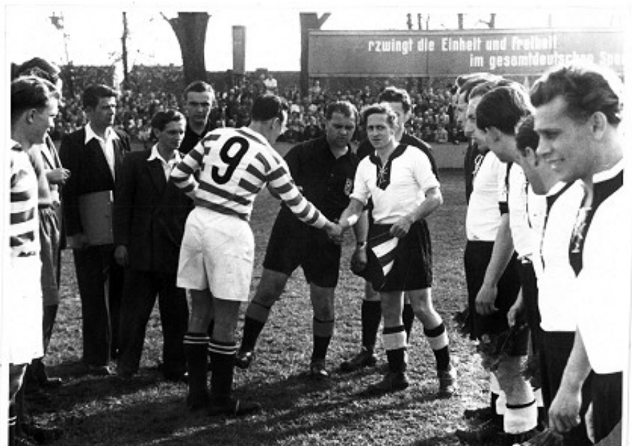
1950 - Schupo beim Spiel Rotation

Als er 1947 endlich aus der Gefangenschaft nach Babelsberg zurückkehrte, war vieles zerstört in Potsdam und Babelsberg. Über eins waren er und andere Spieler sich aber einig. Sie wollten weiter Fussball spielen und dazu reichte ein Team in Babelsberg.